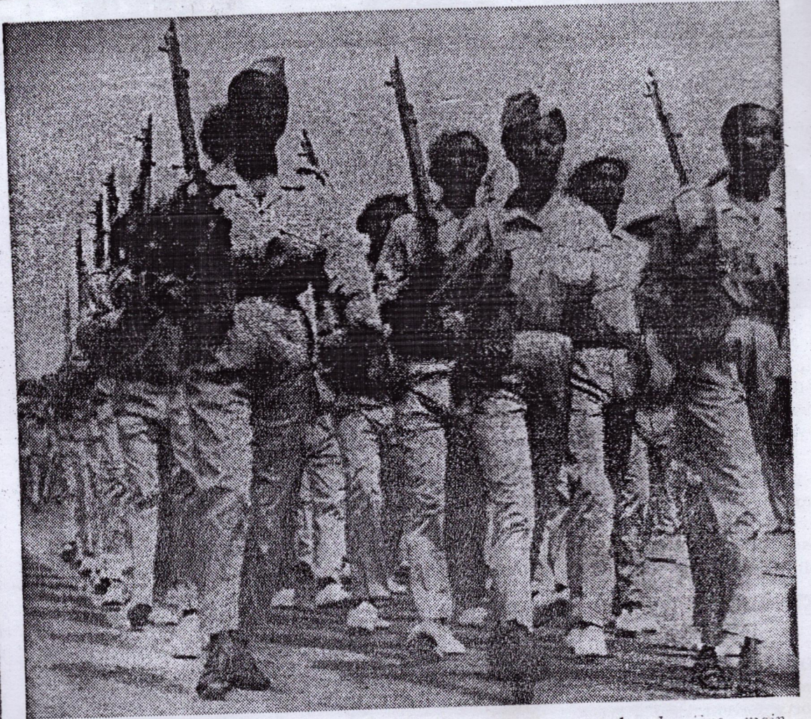
La milice populaire que l'on a vu ces jours derniers mettre la dernière main sur les travaux de nettoyage pour que Conakry prenne un air de fête, sera au grand complet au «Stade du 28 Septembre» à l'occasion de la fête du travail. Ci-dessus la section féminine de la milice populaire de Conakry.